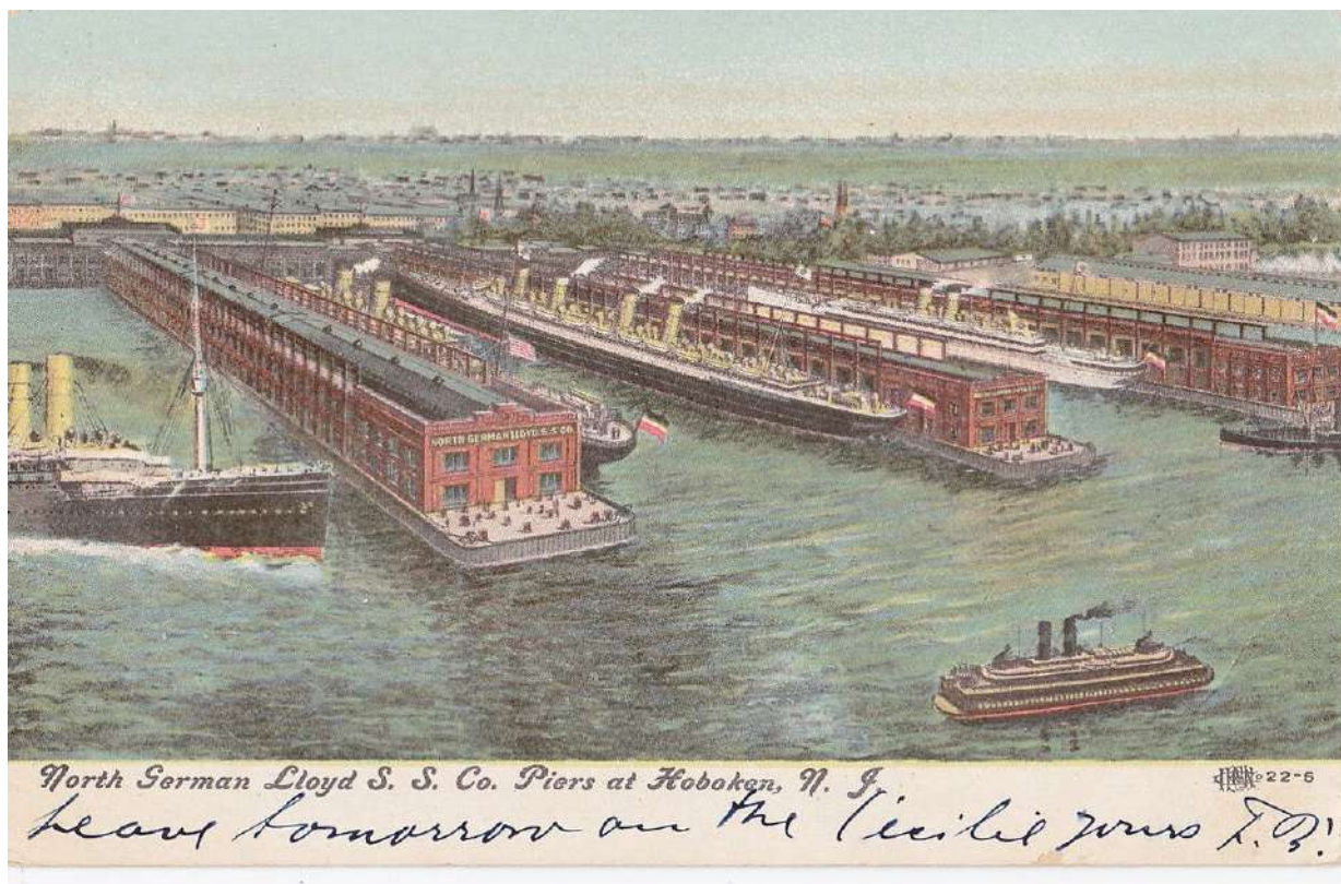
Hoboken, port d'attache de la Compagnie Norddeutscher Lloyd