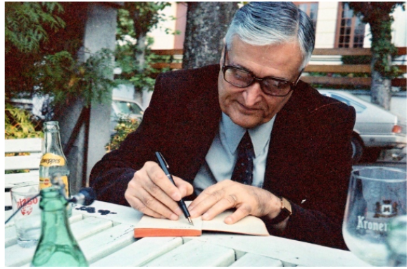
Thomas Narcejac, Châtel-Guillon 1980

Ses plus grands succès comme auteur de littérature policière - avec son ami et complice Pierre Boileau (1906-1989) - sont contemporains de cette époque, ce qui augmentait d'autant son aura de prof.