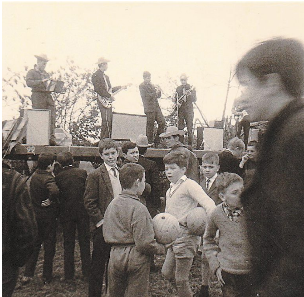
Le groupe de rockabilly du ranch des Dervallières lors d'une kermesse organisée par la Cité des jeunes, près de mille personnes y participeront.