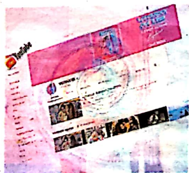
YouTube Space Londres pour les artistes comptant plus de 10 000 fans Assemblage PO